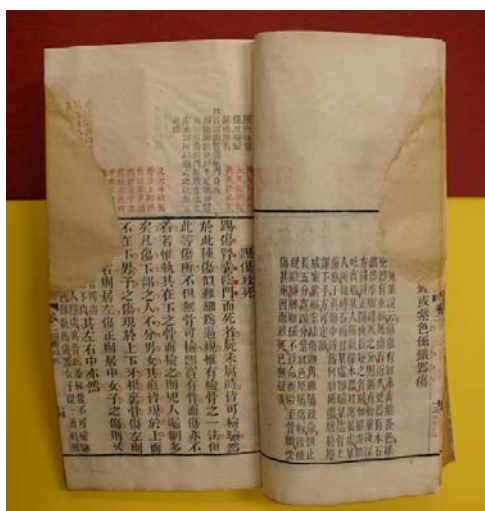
圖三. 四色套印洗冤集錄之內文

及少部分黃斑，令大部份藍字已變成墨綠，使閱者產生錯覺，以為多了一種印色。第二冊全本近書口處缺蝕約有五分之一頁，曾以鈉紙修補，因紙質和原來棉紙不符，令書之東北半構成一高聳硬區，現已有脆脫表現，宜再重補。卷五較多霉斑。