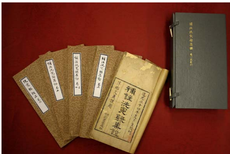
圖一. 補註《洗冤錄集證》

Originally compiled by the famous officer Sung Tzu of Song Dynasty in 1247A.D, it has been recognized by historians of medicine as the oldest extant book on forensic or legal medicine in any civilization. This greatest cultural landmark was not only being studied continuously by many researchers in China, its' practical contents also adopted by various countries and had been translated into different languages since the 18th century.