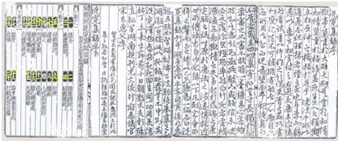
圖四.《洗冤集錄序》宋慈書蹟

《洗冤集錄》，又名《宋提刑洗冤集錄》，俗稱《洗冤錄》五卷 合計53條。書成於南宋理宗淳祐七年 [1247A.D.] 為集宋以前法醫學屍體檢驗之大成的傑作。它涉及到現代法醫學中心內容的大部份，對於屍體的現象、窒息、損傷、現場檢查、屍體檢驗等各方面都作了大量的科學觀察和歸納。提出了血脈墜下(屍斑)的發生機制與分佈；腐敗的表現和影響的條