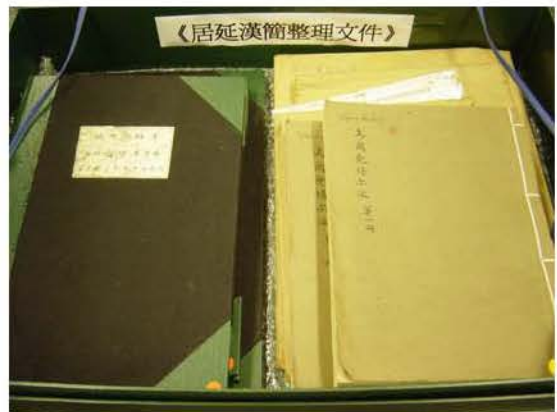
圖二. 紀錄簿與公文袋

4.-7. 為 Pei-ta-ho, Ottik tsaghan, Chiu-tun-tze (Shuang-ch'eng-tze) 雙城子, Taralingin Durbeljin