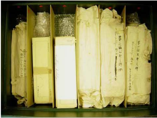
圖一. 《居延漢簡整理文件》