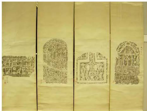
藏品現狀: 圖二. 四幅拓片全貌

而由別人送贈，則未誌於其奏稿或諸藏品之著作中。又因何傳予羅原覺和江天澤，迄今亦未見有所說明。而據館方紀錄，此藏品是於1980年四月在馮平山圖書館登錄，至於上述來歷種種疑團，祈望有興趣的史地學人能作進一步之研究。