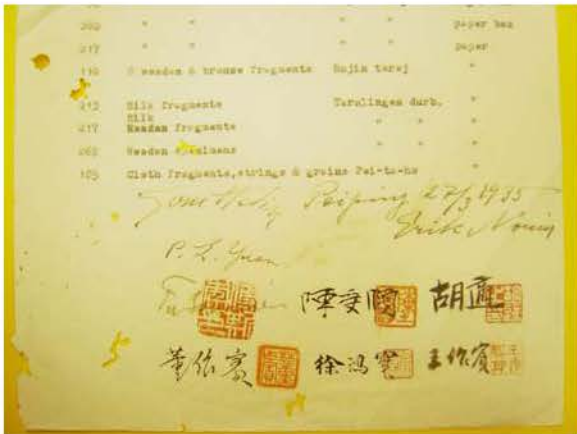
圖三. 清單內的簽署人名和印章

[24.5 x 33 公分] 封面墨書“內赫定、那林書面擔保送回古物函(附詳細表冊)，又【圖書館員】原子筆書蹟“查原函缺”4字。內容為 24 頁打印底本“Collections of the Sino-Swedish Expedition to be taken to Sweden for Study”。所錄 Box NRC1-C4, C7, box C5-6, 合 2460 餘項另加“Collections made by Mr. Bookenkamp, G. Bexell, B. Bohlin total: 27 boxes, 2237 items”總計不下 4697 項的原件於當年被借送往瑞典研究。在清單末頁下半欄書有 1935 年 9 月 27 日九位當事人的簽署真蹟，六人附黔印。