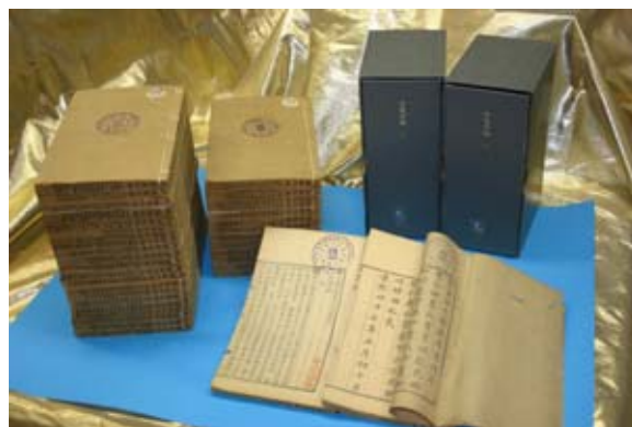
圖一. 《佩文齋廣群芳譜》書影

中國被譽為世界園林之母，是栽培植物的起源中心之一，蔬菜種類最多，花卉栽培史源遠流長，歷代民間培育的無數珍品，不僅豐富了人類文藝與精神生活，對人陶冶性情，還推動了社會地方的經濟發展。著名的花卉專著有《全芳備祖》、《群芳譜》、《廣群芳譜》、《花鏡》等，其中以《廣群芳譜》最受歡迎，因有利農圃苑圃，地方花藝依以競業，平民居家園藝引作指南，教習文士尋章索句案上便冊，像康熙及歷朝帝皇均重視此書，直至光緒年間仍收錄在宮廷的古董房書架第三架上，給皇室子弟和大臣隨時借用。回視香港“花展”之陣容形同市集，花訊稀查，主辦者若早讀此書，翻查“杜鵑花”的資料，或可得營運新意，不至年年如是！